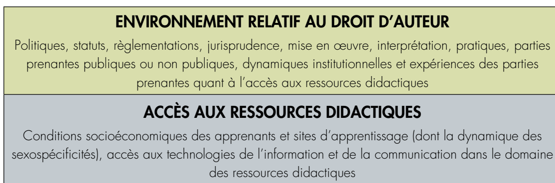
Figure 1: Parties constituant l'environnement du droit d'auteur et l'accès aux ressources didactiques