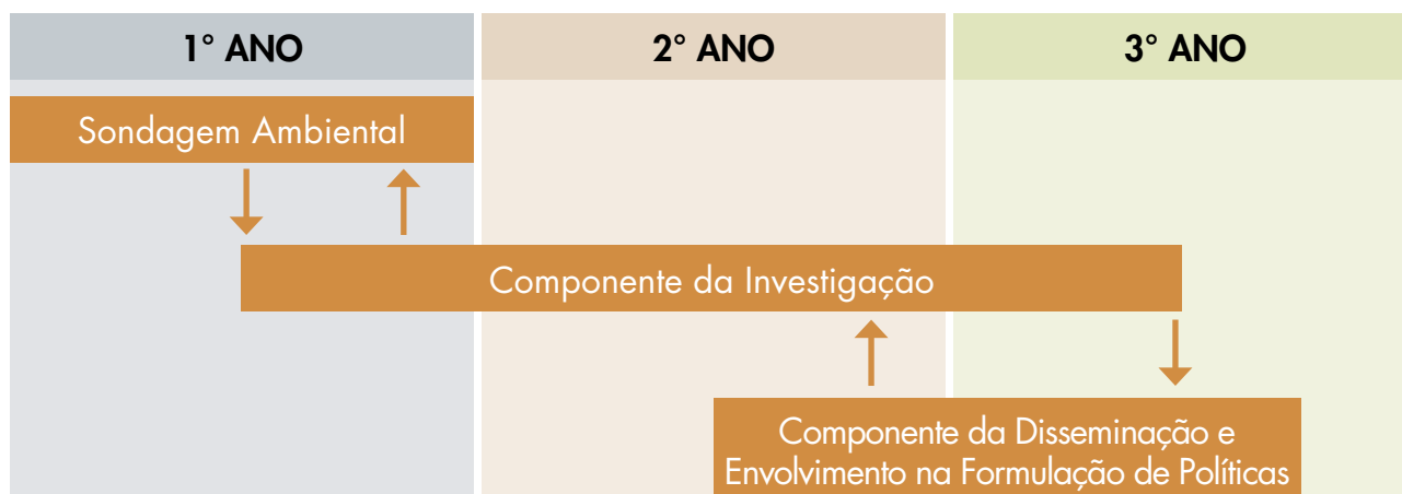
Figura 3: Componentes do Projecto ACA2K

Estes dois componentes do projecto, embora lineares, não o são estritamente falando, visto que se sobrepõem um sobre o outro. (No entanto, por razões éticas, torna-se necessário que os investigadores não tentem exercer influência indevida nas políticas antes ou depois da fase de recolha de dados, para não prejudicar os resultados da investigação). A sondagem ambiental constitui o ponto de partida para planear a investigação nacional e igualmente para planear o eventual envolvimento na formulação de políticas. Todavia, até mesmo o Componente da Investigação irá criar oportunidades para apontar parceiros limite, firmar alianças e solidificar estratégias de apoio que sejam plenamente aplicadas através do Componente da Disseminação e Envolvimento na Formulação de Políticas. As alterações e combinações da sobreposição subsequente entre os dois componentes são naturalmente imprevisíveis; daí as sobreposições específicas serem, em larga medida, decisões das equipas de investigação nacional. No entanto, num período de dois anos e meio, por exemplo, os componentes poderão cruzar-se da seguinte forma: